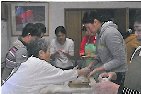
技術の伝承がおこなわれております