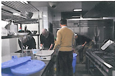
前々日の米洗いと当日米を蒸すのは北区社協の厨房をお借りしました

Kilano Network Kilano Network Kilano Network Kilano Network Kilano Network Kilano Network