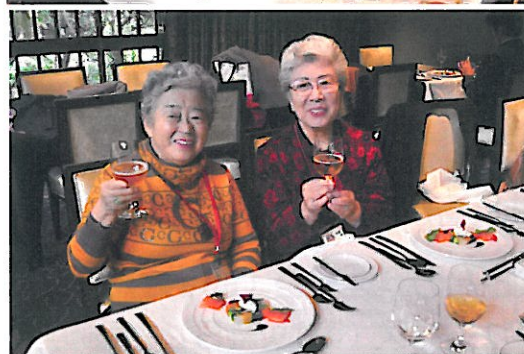
いつもおいしい所へつれていってもらって、幸せ！