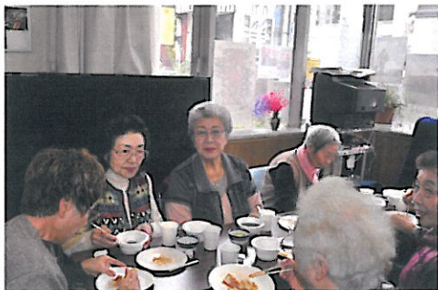
毎年楽しみにしています、来年もたのみます！