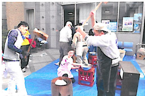
2人でつく時は、とりがむつかしい