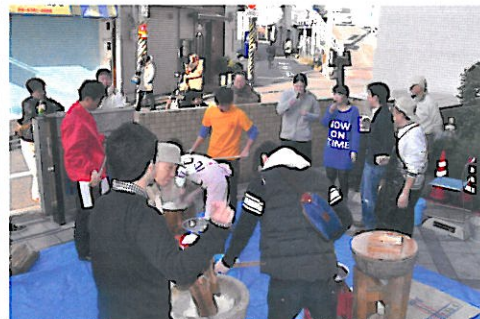
若い衆がたくさん来てくれた