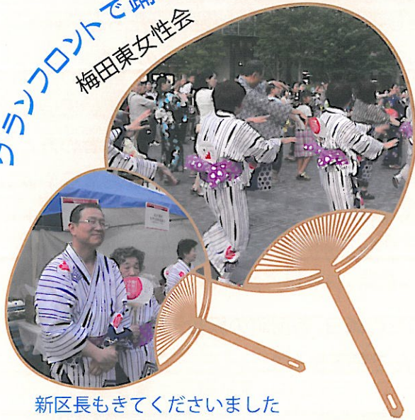
新区長もきてくださいました