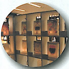
ペーパーバック行燈展

12月11日。恒例となりました100万人のキャンドルナイト@OSAKACITY2013冬が茶屋町各所で開催されました。今回はお天気の都合で1時間遅れのスタートとなりましたが、それでも昨年同様それ以上の来場者数で、このイベントを楽しみにされていた人々で大変な賑わいでした。街角には地域の方々や、クリエイターの方々によるキャンドル作品が街に明かりと彩りを与え、冬の茶屋町に人々の暖かい笑みがこぼれていました。また、当地区の子供会からも「ペーパーバック行燈展」への出展がなされ、子供達の力作がNU茶屋町3階のテラスで飾られました。