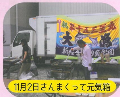
11月2日さんまくって元気箱