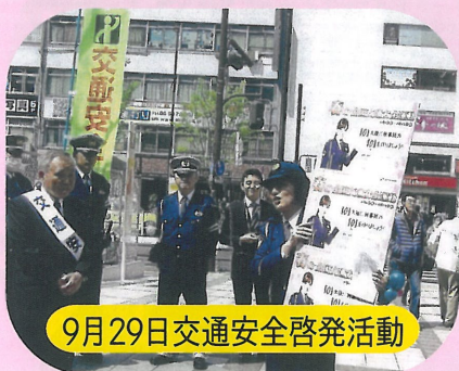
9月29日交通安全啓発活動